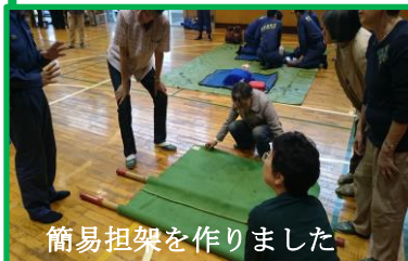
簡易担架を作りました