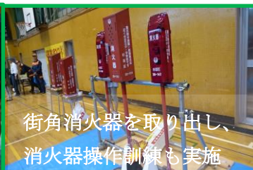
街角消火器を取り出し、消火器操作訓練も実施