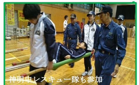
神明中レスキュー隊も参加

110名が参加。参加者からは「見学するのではなく実際に体験でき、とても良かった」「簡易担架に乗ってみたが思ったより楽だった」などの感想がありました。反省点としては、トランシーバーの通信がうまくできず、別途訓練の必要性を実感しました。お忙しい中ご参加くださいました皆さま、ありがとうございました。