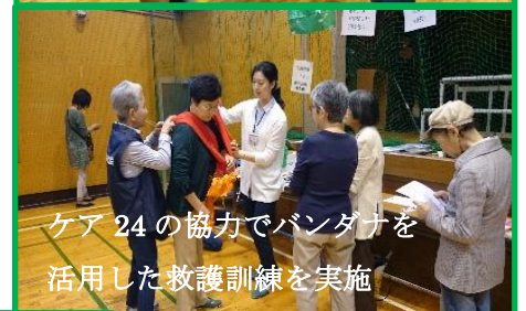
ケア24の協力でバンダナを活用した救護訓練を実施