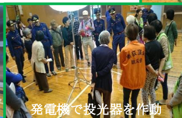
発電機で投光器を作動